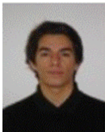
Hugo Resp. After Works